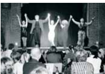
DAS VARIÉTÉ PEGASUS zu Gast bei EVENCE