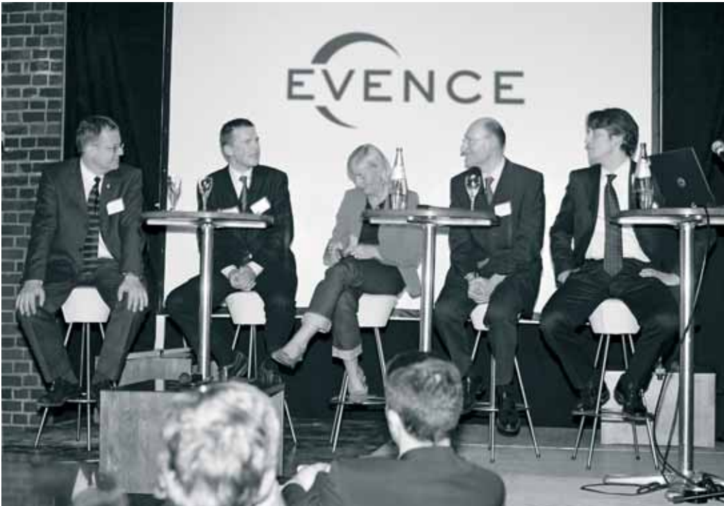
TALKRUNDE über die Mars-Mission. Moderiert von Steffen Seibert