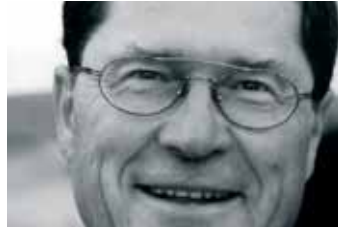
PETER BENZ Oberbürgermeister a.D. der Wissenschaftsstadt Darmstadt

Was macht heute einen Wirtschafts- und Wissenschaftsstandort im globalen Wettbewerb aus? Welches sind die Faktoren, welche den Ausschlag geben, dass eine Stadt unter sich gleichenden Konkurrenten um Ansiedlungen die Nase vorn hat?